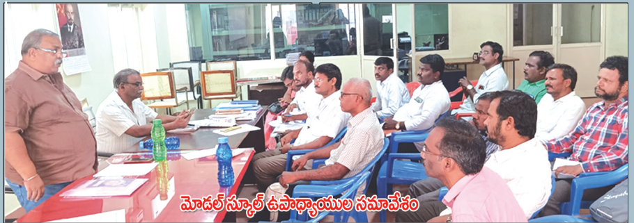
మోడల్ స్కూల్ ఉపాధ్యాయుల సమావేశం