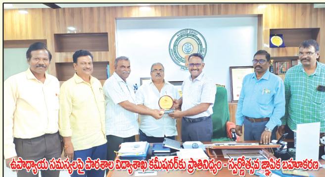
ఉపాధ్యాయ సమస్యలపై పాఠశాల విద్యాశాఖ కమీషనర్ కు ప్రాతినిధ్యం = స్వర్ణోత్సవ జ్ఞాపిక బహుకారం