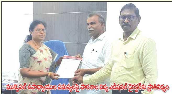
మున్సిపల్ ఉపాధ్యాయుల సమస్యలపై పాఠశాల విద్య ఎడిషనల్ డైరెక్టర్ కు ప్రాతినిధ్యం