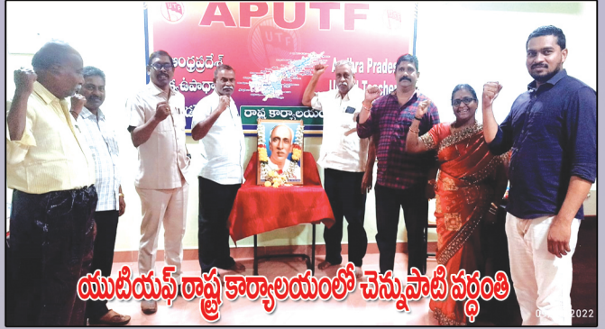
యుటియస్ రాష్ట్ర కార్యాలయంలో చెన్నుపాటి వర్గంతి