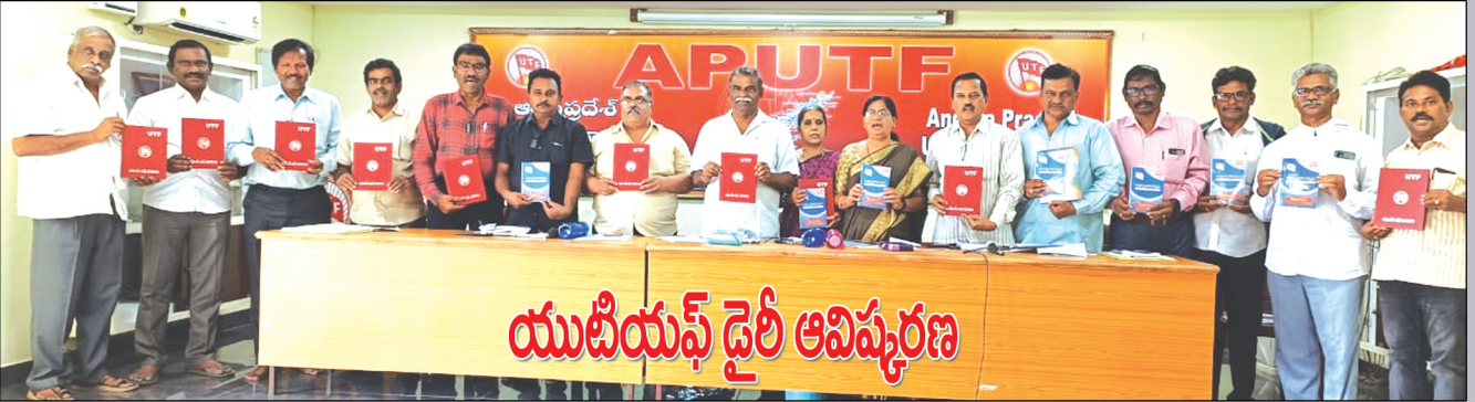
యుటియస్ డైరీ ఆవిష్కరణ