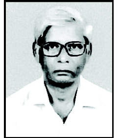
సి.వి.కృష్ణయ్య జనవిజ్ఞాన వేదిక