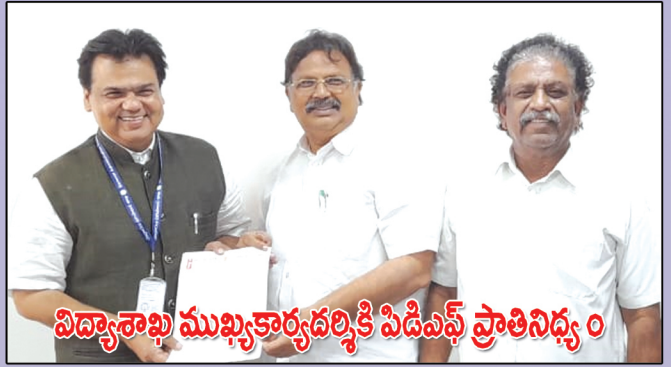
విద్యాశాఖ ముఖ్యకార్యదర్శికి పిడిఎఫ్ ప్రాతినిధ్యం