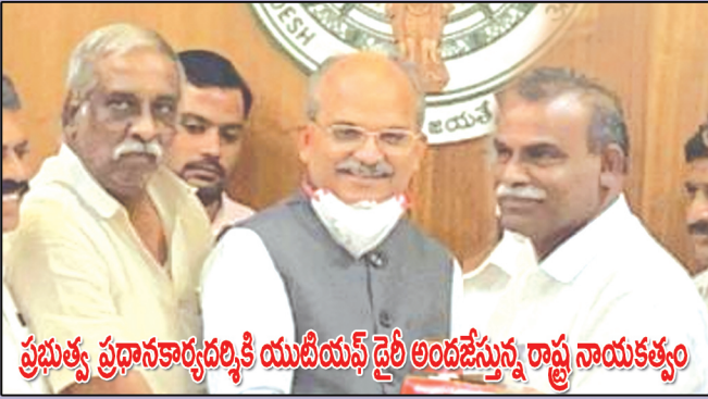
ప్రభుత్వ ప్రధానకార్యదర్శికి యుటియస్ డైరీ అందజేస్తున్న రాష్ట్ర నాయకత్వం