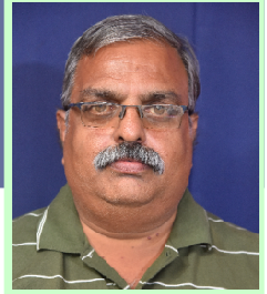
కె.ఎన్.ఎస్.ప్రసాద్ యూటియఫ్ రాష్ట్ర ప్రధానకార్యదర్శి

2022-23 విద్యా సంవత్సరంలో ఉపాధ్యాయుల బదిలీలు జరిపేందుకు రాష్ట్ర విద్యాశాఖ సిద్ధమయ్యింది. జిఓ 117ను అమలు చేయడంతోబాటు దాని మేరకు బదిలీ నిబంధనలు జిఓ 187; తేదీ. 10.12.2022 రూపొందించారు. ఉపాధ్యాయ సంఘాలతో చర్చల తర్వాత 1,2 మార్పులు చేసి మిగిలిన వాటికి ససేమిరా అన్నారు. దీనితో ఉపాధ్యాయుల్లో పెద్ద ఎత్తున అసంతృప్తి మొదలైంది.