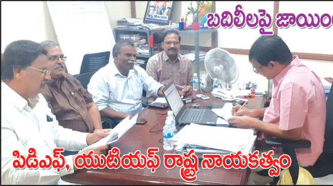
పిడిఎఫ్, యుటియస్ రాష్ట్ర నాయకత్వం