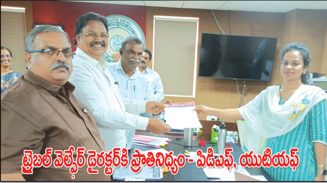
టైబల్ నెవ్రేర్ డైరెక్టర్ కి ప్రాతినిధ్యం - పిడిఎఫ్, యుటియస్