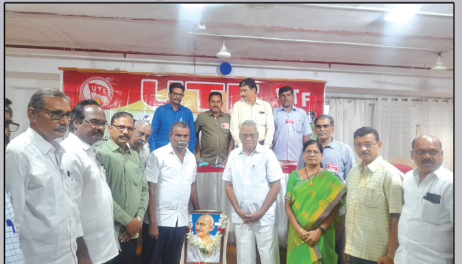
గాంధీ జయంతి సందర్భంగా నివాళి