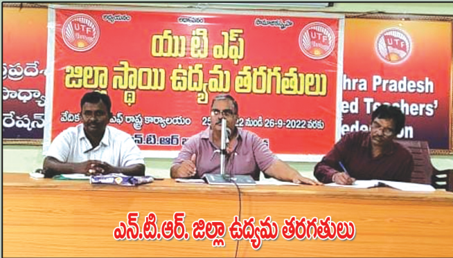
ఎన్.టి.ఆర్. జిల్లా ఉద్యమ తరగతులు