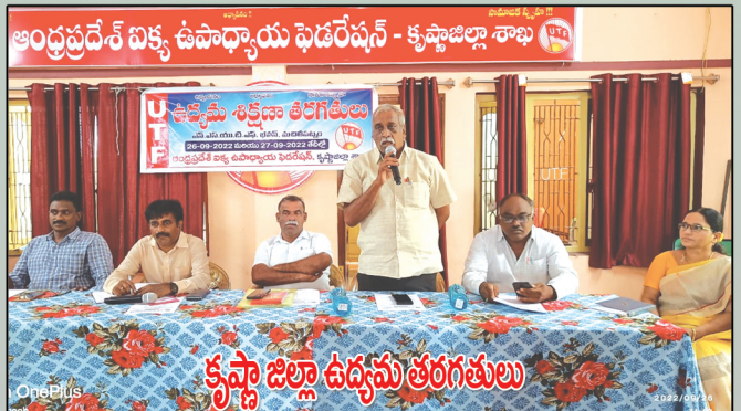
కృష్ణా జిల్లా ఉద్యమ తరగతులు