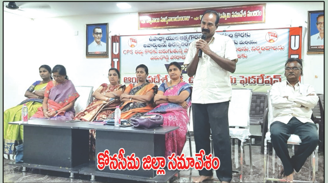
కొనసీమ జిల్లా సమావేశం