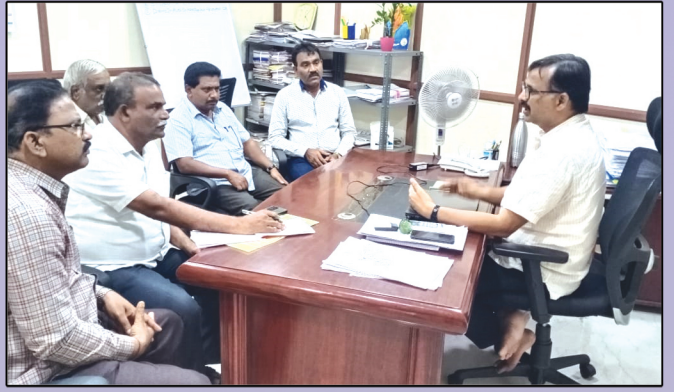
జాయింట్ డైరెక్టర్ తో యుటియఫ్ చర్చలు