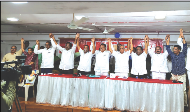
ఎమ్యెల్సీ అభ్యర్థుల పరిచయం