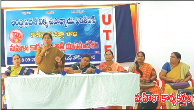
మహిళా కార్యకర్తల సమావేశం - కాకినాడ