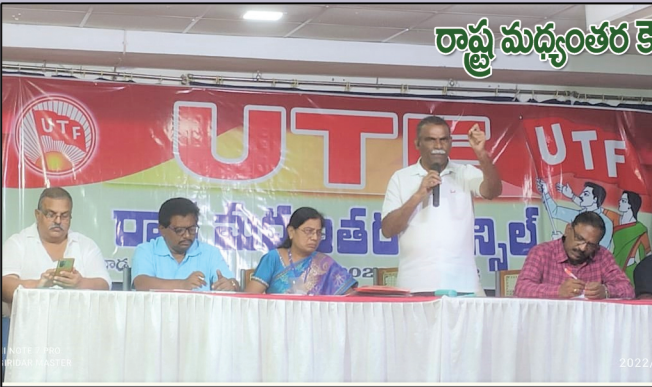
రాష్ట్ర మధ్యంతర కౌన్సిల్ సమావేశాలు