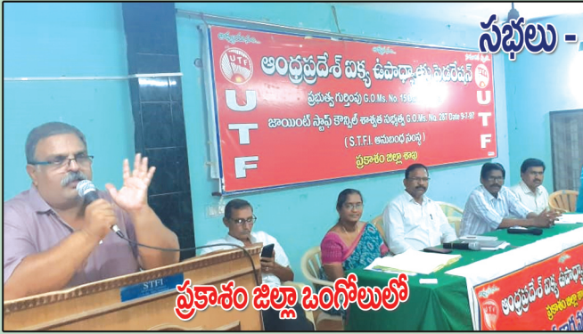
సభలు - సమావేశాలు