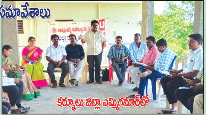
కర్నూలు జిల్లా ఎమ్మిగనూర్లో