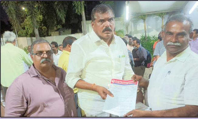
విద్యాశాఖ మంత్రికి ప్రాతినిధ్యం చేస్తున్న యుటియఫ్ రాష్ట్ర అధ్యక్ష ప్రధాన కార్యదర్శులు