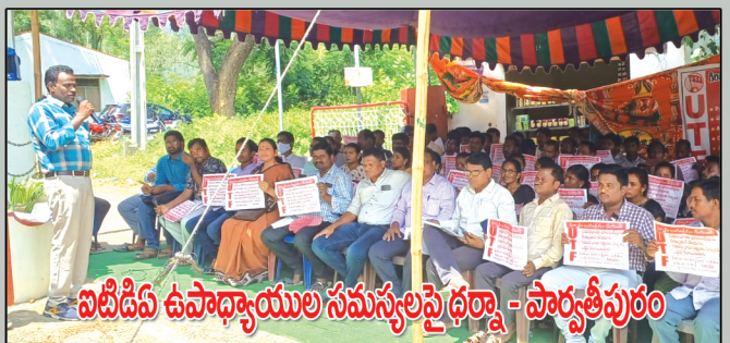
విటిడిఏ ఉపాధ్యాయుల సమస్యలపై ధర్నా - పార్వతీపురం