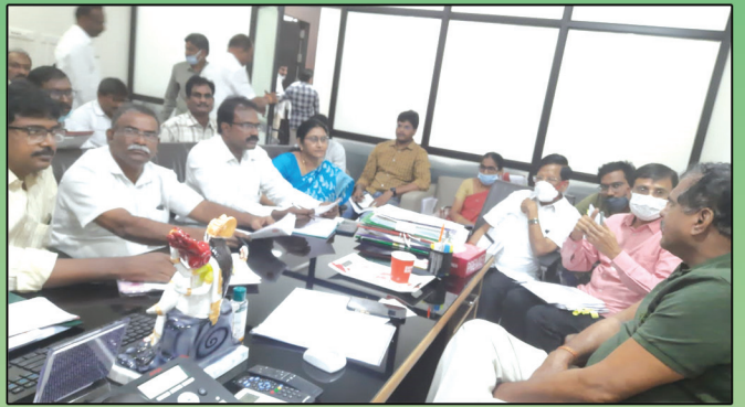
ప్యాప్సోతో విద్యాశాఖ మంత్రి చర్చలు