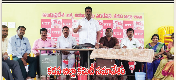
కడప జిల్లా కమిటీ సమావేశం