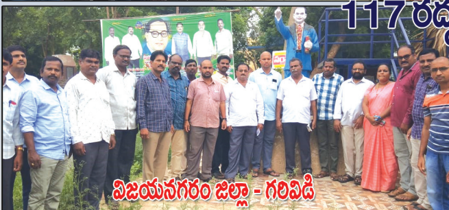
117 రద్దు గురించి