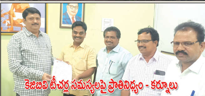
కెజిబివీ టీచర్ల సమస్యలపై ప్రాతినిధ్యం - కర్నూలు