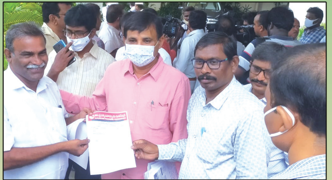
జాయింట్ డైరెక్టర్ కు యుటియఫ్ నాయకత్వం ప్రాతినిధ్యం