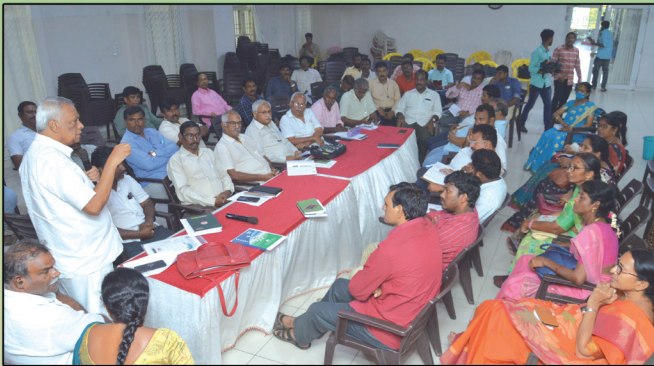
పాఠశాలల పరిరక్షణ వేదిక రౌండ్ టేబుల్ సమావేశం