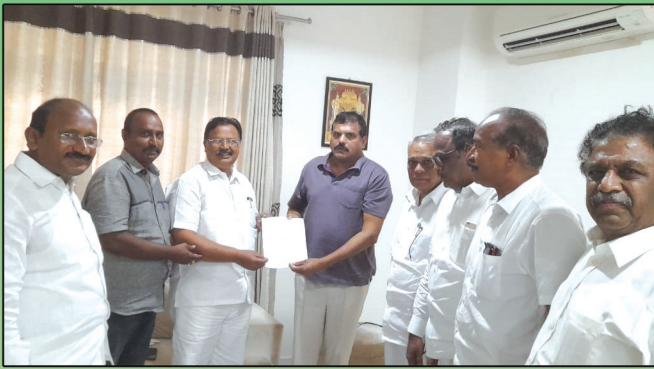
విద్యాశాఖా మాతృలు గారికి ఎమ్మెల్సీలు ప్రాతినిధ్యం