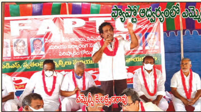
ప్ర్యాప్టో ఆధ్వర్యంలో ఎమ్మెల్సీల నిరసన ఓక్ష ధ్వజాలు