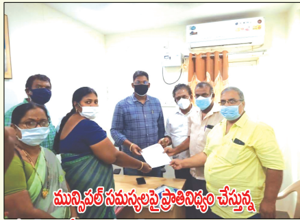
పడిపన్ ఎమ్మెల్యే, యుటియస్ రాష్ట్ర అధ్యక్ష, ప్రధాన కార్యదర్శులు