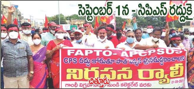
సెప్టెంబర్ 1న - సిపిఎస్ రద్దుకై స్వాప్రార్థి, బహిరంగ సభలు