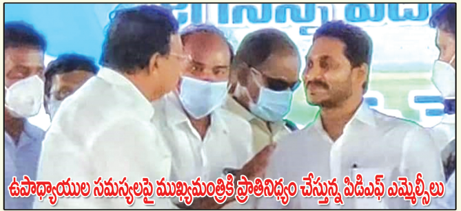
ఉపాధ్యాయుల సమస్యలపై ముఖ్యమంత్రికి ప్రాతినిధ్యం చేస్తున్న పిడిఎఫ్ ఎమ్మెల్యేలు