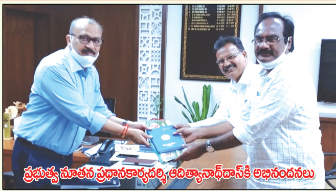
ప్రభుత్వ సూతన ప్రధానకార్యదర్శి ఆదిత్యానాథ్ దాస్ కి అభినందనలు