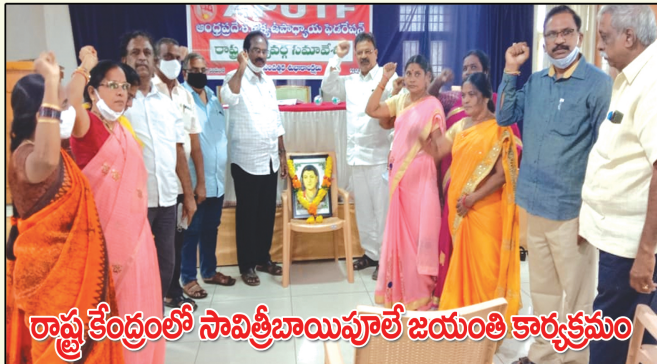
రాష్ట్ర కేంద్రంలో సావిత్రీబాయిపూలే జయంతి కార్యక్రమం