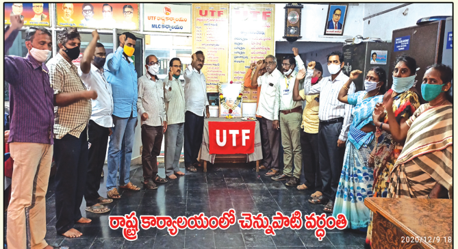
రాష్ట్ర కార్యాలయంలో చెన్నుపాటి వర్గంతి