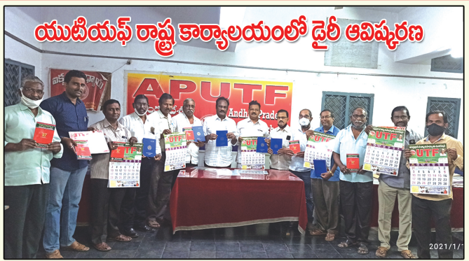
యుటియన్ రాష్ట్ర కార్యాలయంలో డైరీ ఆవిష్కరణ