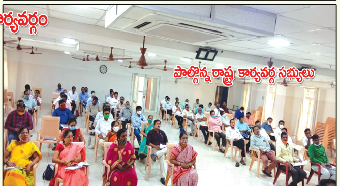
పాల్గొన్న రాష్ట్ర కార్యవర్గ సభ్యులు