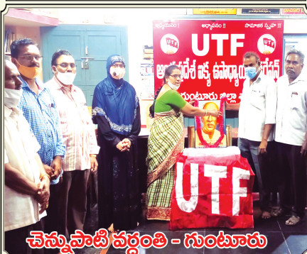
చెన్నైపాటి వర్గంతి - గుంటూరు