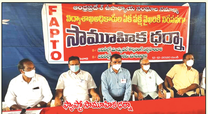
ఫ్యాక్టర్ సామూహిక ధర్నా