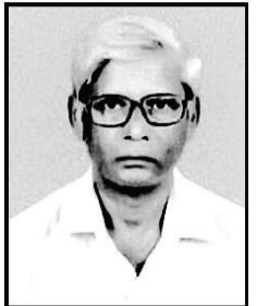
సి.వి.కృష్ణయ్య జనవిజ్ఞాన వేదిక

(బడి, టీచరు, అక్షరాలు, అంకెలు, పరీక్షలు)