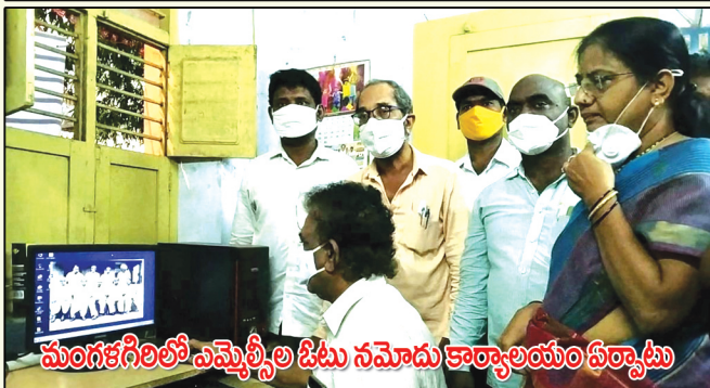
మంగళగిరిలో ఎమెన్టీవీల డిటు నమోదు కార్యాలయం ఏర్పాటు