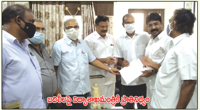
బదిలీలపై విద్యాశాఖమంత్రికి ప్రాతినిధ్యం