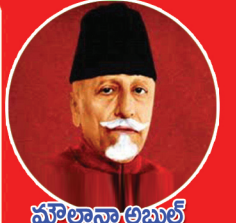
మౌలానా అబుల్ కలామ్ ఆజాద్

ఆంధ్రప్రదేశ్ విక్యఉపాధ్యాయ ఫెడరేషన్ అధికార పత్రిక