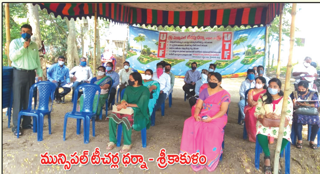
మున్సిపల్ టీచర్ల ధర్నా - శ్రీకాకుళం