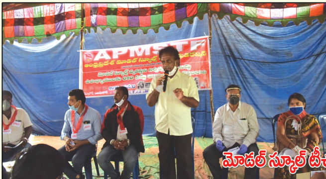
మోడల్ స్కూల్ టీచర్ల నిరాహార దీక్ష