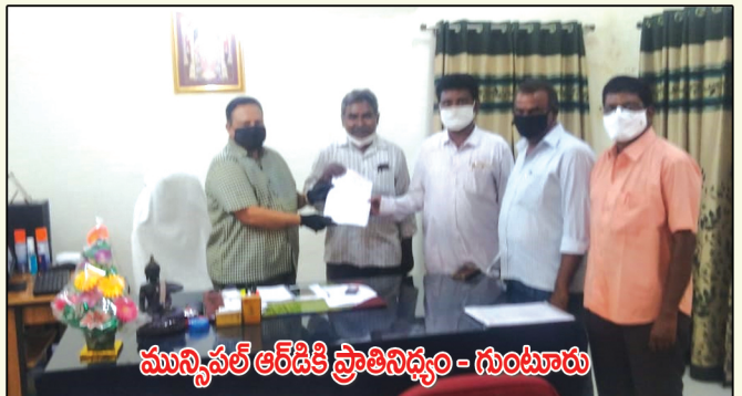
మున్సిపల్ ఆర్డిసికి ప్రాతినిధ్యం - గుంటూరు