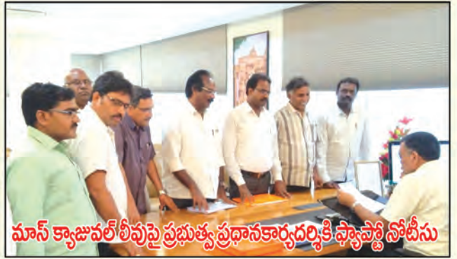
మాన్ క్యాజువల్ లీవుపై ప్రభుత్వ ప్రధాన కార్యదర్శికి ఫ్యాక్టర్స్ నోటీసు