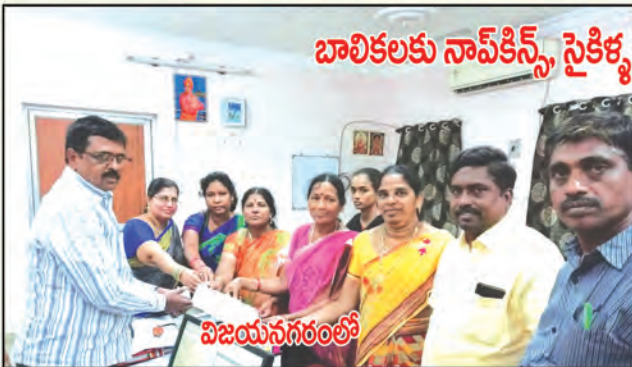
బాలికలకు నావ్ కిస్స్, సైకిళ్ళ పంపిణీ గురించి ప్రాతినిధ్యం