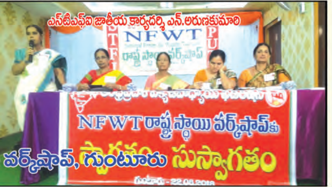
ఎన్‌ఐఎఫ్‌ఐ జాతీయ కార్యదర్శి ఎన్.అరుణకుమారి

అంధత్వంపై పక్కా పరిష్కారాలు చేపట్టాలి NFWT రాష్ట్ర స్థాయి వర్క్‌షాప్ ఎన్‌ఐఎఫ్‌డబ్ల్యుటి రాష్ట్ర స్థాయి వర్క్‌షాప్, గుంటూరు సుస్వగతం గుంటూరు - 22.08.2018