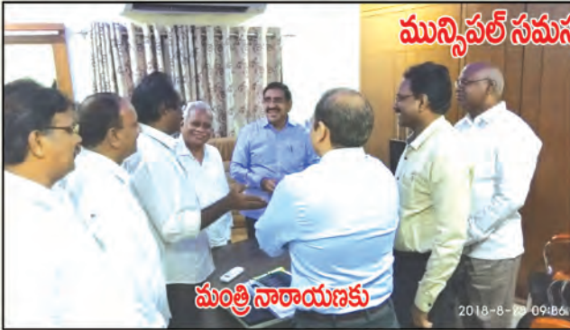
మున్సిపల్ సమస్యలపై ప్రాతినిధ్యం