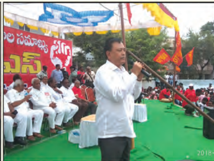
క్విట్ సిపిఎస్ - బహిరంగ సభలో ఎం.పి.గవూర్