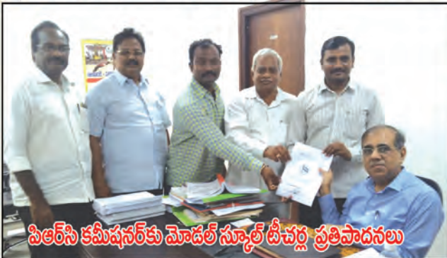
పిఆర్‌సి కమీషనర్‌కు మోడల్ స్కూల్ డీచర్ల ప్రతిపాదనలు