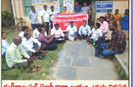
దుగ్గిరాల సబ్ ట్రైబిల్ కార్యాలయం ఎదుట నిరసన