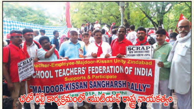
ఛలో ఢిల్లీ కార్యక్రమంలో యుటియఫ్ రాష్ట్ర నాయకత్వం