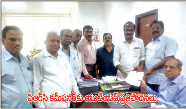
పిఆర్‌సి కమీషనర్‌కు యుటియఫ్ ప్రతిపాదనలు