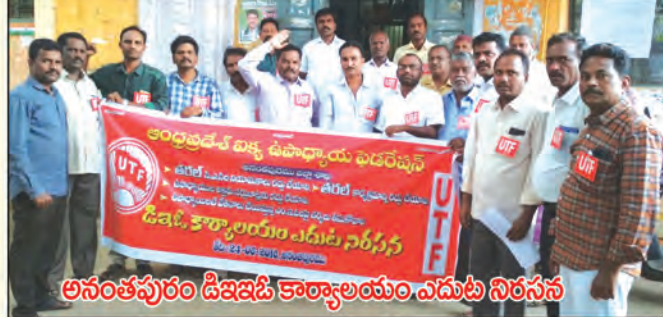
అనంతపురం డిజిడి కార్యాలయం ఎదుట నిరసన