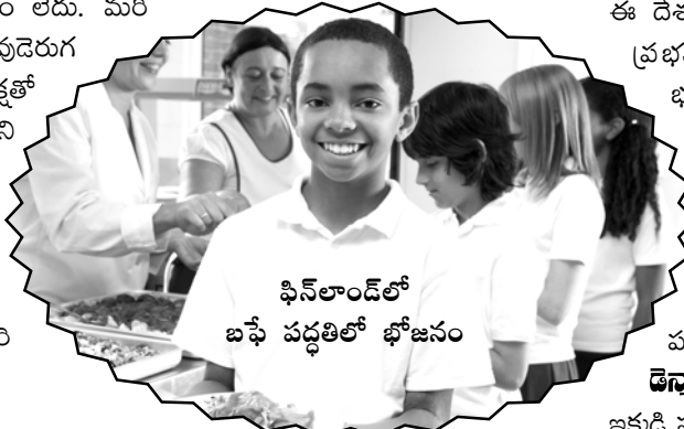
ఫిన్లాండ్ లో బఫే పద్ధతిలో భోజనం