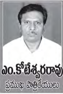
ఎం.కోటేశ్వరరావు ప్రముఖ సాహితీకారులు

తొత్తుకు బడితొత్తు అన్నట్లుగా ప్రపంచ ధనిక దేశాల కనుసన్నలలో నడిచే అంతర్జాతీయ సంస్థల ఆదేశాలను మన కేంద్ర ప్రభుత్వం అమలు జరుపుతోంది. దాని కొనసాగింపుగా అది రాష్ట్రాలపై తన షరతులను రుద్దుతోంది. తమ దగ్గర అప్పులు తీసుకొనే దేశాలన్నీ ద్రవ్యలోటును మూడుశాతానికి పరిమితం చేసుకోవాలన్నది వాటి ప్రధమ షరతు. అందుకోసం ద్రవ్య జవాబు దారీ మరియు బడ్జెట్ యాజమాన్యం(ఎఫ్ఆర్బిఎం) చట్టాలను చేయాలని అంతర్జాతీయ ఆర్థిక సంస్థలు విధించిన షరతును మన కేంద్ర, రాష్ట్ర ప్రభుత్వాల తు.చ తప్పకుండా అమలు జరుపుతున్నాయి. దానికి