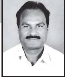
పవిత్రయ్యపేట ప్రధాన కార్యదర్శి

రాష్ట్ర ప్రభుత్వం “బడిపిలుస్తోంది” అంటూ ప్రత్యేక కార్యక్రమాలు నిర్వహిస్తూ... మరోవైపు యుపి పాఠశాలల మూతకు రంగం సిద్ధం చేయడం శోచనీయం. రాష్ట్రంలో “అందుబాటు”లో పాఠశాలలు అంటూ ప్రతి 1 కి.మీ.కు ప్రాథమిక పాఠశాల, ప్రతి 3 కి.మీ.లో ఒక ప్రాథమికోన్నత పాఠశాల, 5 కి.మీ.లోపు ఉన్నత పాఠశాలలు ఏర్పాటు చేశారు. 1 కి.మీ.లోపు ప్రాథమిక పాఠశాల అనేది 1,2,3 తరగతులను దృష్టిలో ఉంచుకొని ఏర్పాటుచేసినా ఒకే గ్రామంలో అనేక పాఠశాలలు కావడంతో వికేంద్రీకరణ ఎక్కువై ప్రాథమిక పాఠశాలలు అతి తక్కువ మంది పిల్లలతో ఒకరు లేదా ఇద్దరు టీచర్లతో నడుస్తున్నాయి. వీటి పరిస్థితి మెరుగుపరిచే ఆలోచనలు మానేశారు.