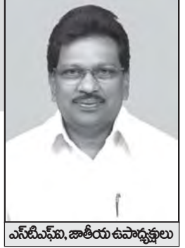
ఎన్.టి.ఎఫ్.ఐ. జాతీయ ఉపాధ్యక్షులు

వి ద్యాహక్కు చట్టాన్ని పటిష్టంగా అమలు చేయాలని కేంద్ర, రాష్ట్ర ప్రభుత్వాలను కోరుతూ దేశవ్యాప్తంగా ప్రచార కార్యక్రమం నిర్వహించాలని భారత పాఠశాల ఉపాధ్యాయ సమాఖ్య (STFI) పిలుపు యిచ్చింది. అందులో భాగంగా ఈ నెల 10-12 తేదీల్లో రాష్ట్రస్థాయి సదస్సులు నిర్వహించాలి. వచ్చే సెప్టెంబర్ చివరిలో లేదా అక్టోబర్ మొదటి వారంలో జాతీయ స్థాయి సదస్సు ఢిల్లీలో జరుగుతుంది. రాష్ట్రస్థాయి సదస్సుల నిర్వహణ తదితర ప్రచార కార్యక్రమాలను STFI అనుబంధ సంఘాలు ఆయా రాష్ట్రాల్లో అమలు చేయాలి. తెలుగు వారి రెండు రాష్ట్రాల్లోనూ ఈ పిలుపును జయప్రదం చేయటానికి పూనుకోవాలి.