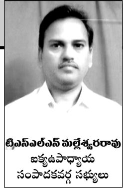
టీఎన్ఎల్ఎస్ మల్టీశ్రరూపు ఐక్యఉపాధ్యాయ సంపాదకవర్గ సభ్యులు

2015-16 ఆర్థిక సంవత్సరంనకు సంబంధించి (01.04.2015 నుండి 31.03.2016 వరకు గల ఆదాయము) ఉద్యోగులు చెల్లింపు చేయవసిన ఆదాయపుపన్నుకు సంబంధించిన సర్క్యులర్ నం.20/2015; తేది.02.12.2015 ద్వారా ఆదాయపుపన్ను శాఖ విడుదల చేయటం జరిగింది. ఆదాయపుపన్ను లెక్కింపు విధానము పరిశీలిద్దాము.