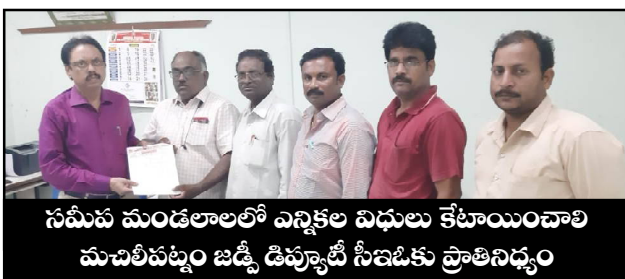
సమీప మండలాలలో ఎన్నికల విధులు కేటాయించాలి మచిలీపట్నం జడ్చి డిప్యూటీ సీఐఓకు ప్రాతినిధ్యం