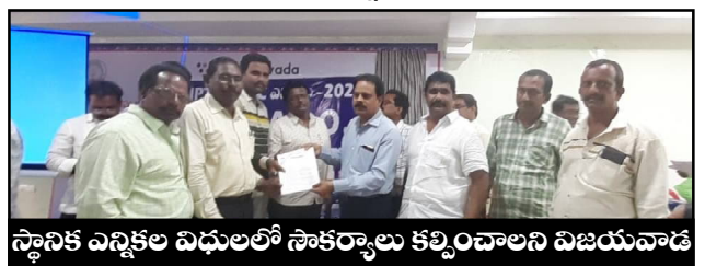
స్థానిక ఎన్నికల విధులలో సాకర్వాలు కల్పించాలని విజయవాడ రూరల్ - లిటల్స్ ఆధికారికి ప్రాతినిధ్యం